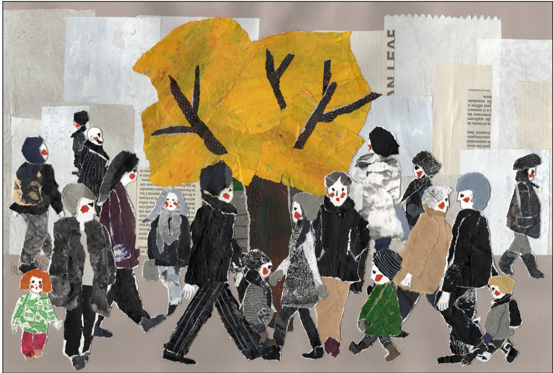
"La foule", 2017, technique collage sur papier, 21 x 29,70 cm