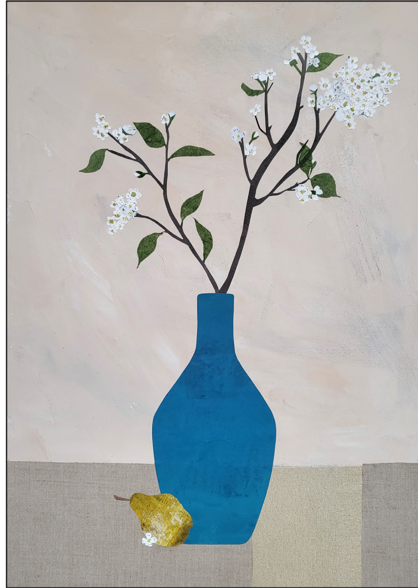
"La branche de poirier", 2024, technique collage sur toile, 70 x 50 cm