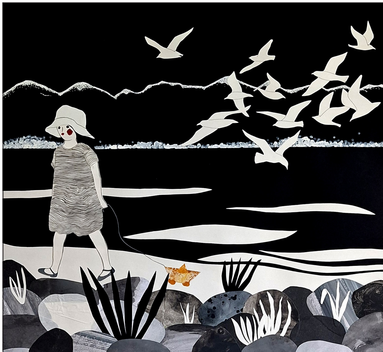
"Variation, la fillete au chapeau", 2025, technique collage et technique mixte, sur papier, 50 x 50 cm