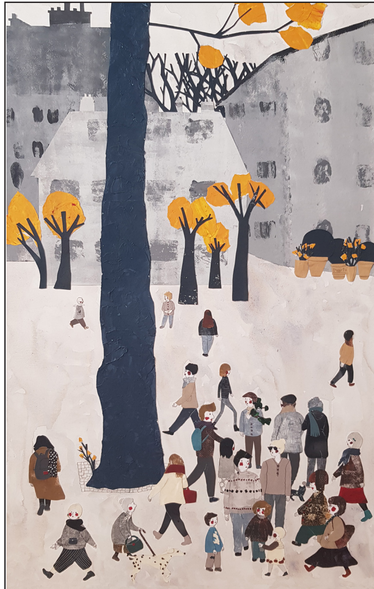
"Quartier", 2023, technique collage et technique mixte sur toile, 100 x 60 cm