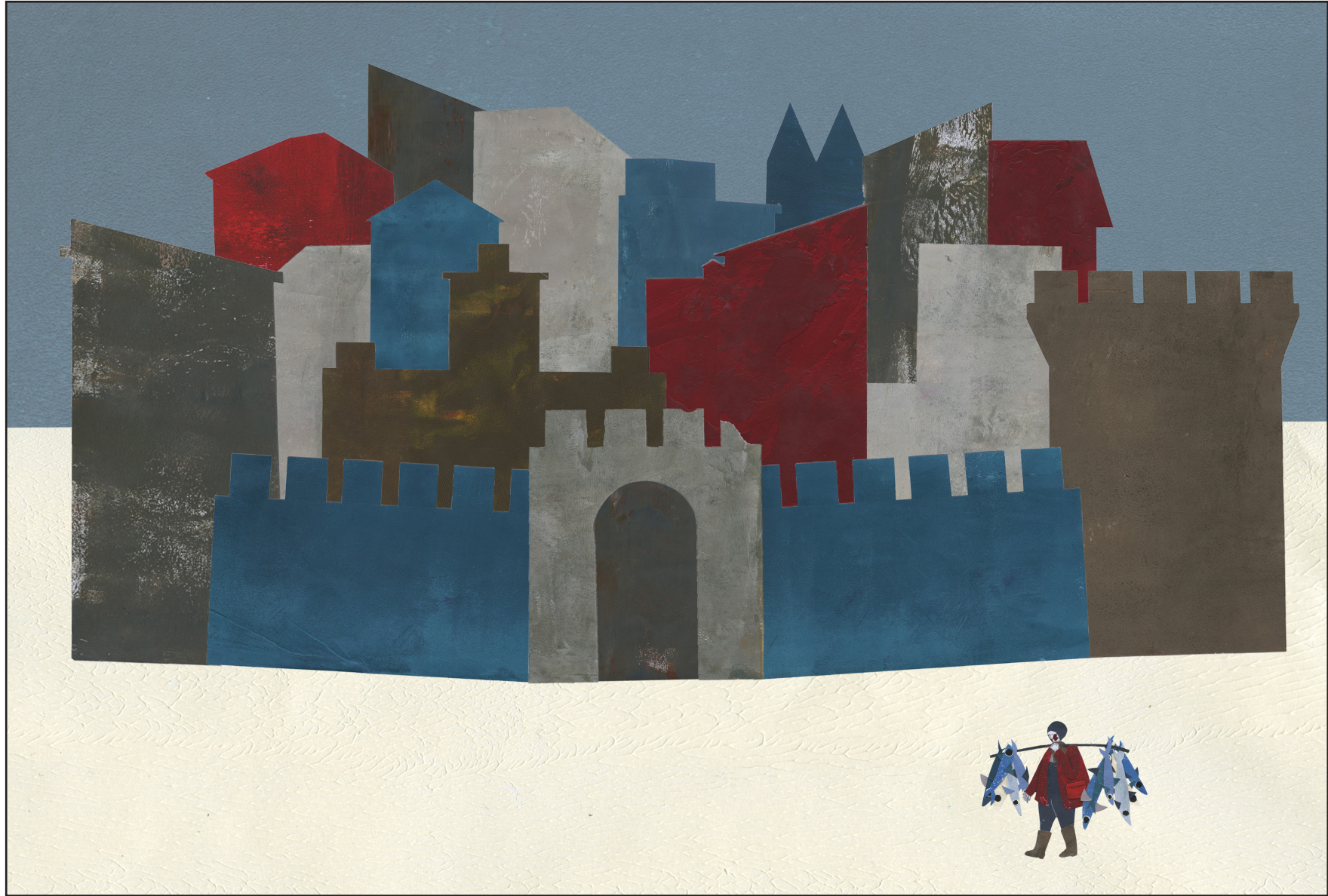
"Château avec pêcheur", 2023, technique collage, papier et digital, 32,90 x 48,30 cm