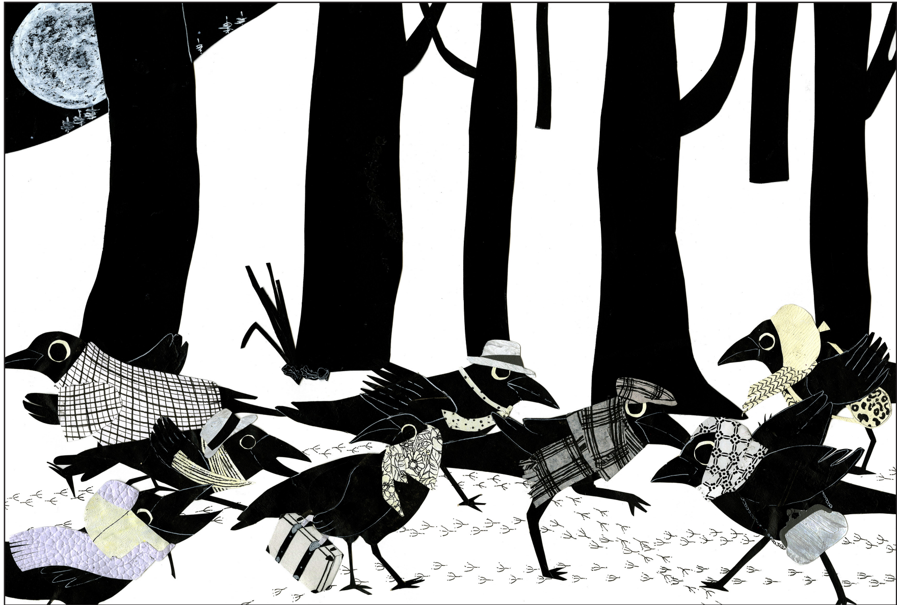
"Corbeaux", 2024, technique collage et technique mixte sur papier, 29,70 x 42 cm